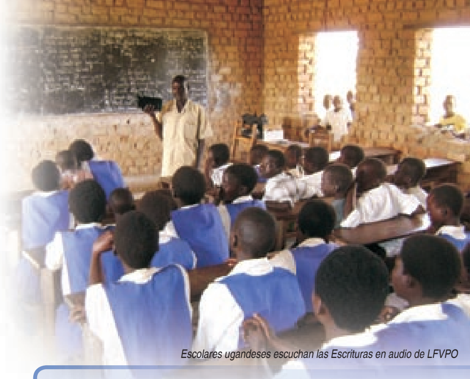
Escolares ugandeses escuchan las Escrituras en audio de LFVPO

Sin embargo, en las últimas décadas el mundo ha cambiado tremendamente. Ya no es cierto que 'oriente es oriente y occidente es occidente', porque hemos sido testigos del mayor desplazamiento