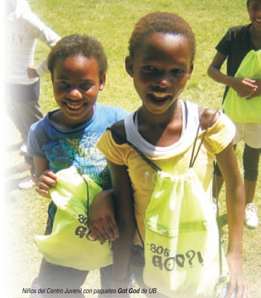
Niños del Centro Juvenil con paquetes Got God de UB