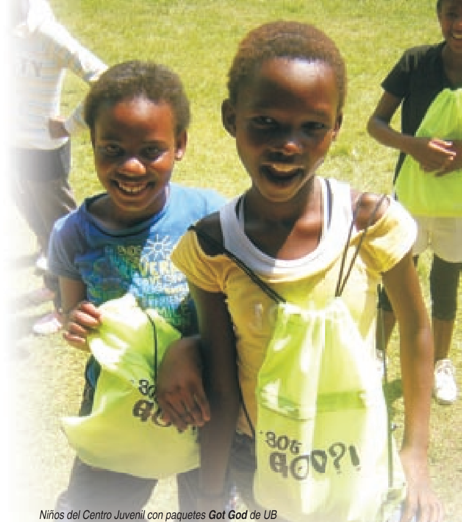
Niños del Centro Juvenil con paquetes Got God de UB