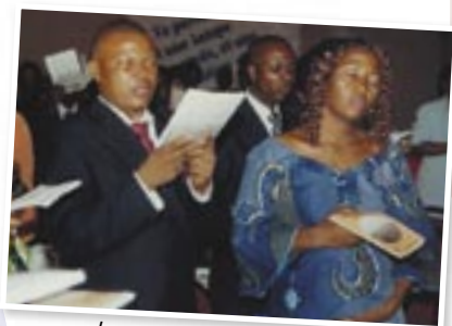
Lancement du Lecteur 2008

Des directives ont été approuvées, comprenant : l'adoption de principes directeurs pour les notes des différents matériaux (adultes, jeunes et enfants) ; l'adoption de changements au niveau du contenu ; la nécessité d'aider les utilisateurs à