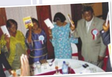
Lancement du Lecteur 2007

En 1981, le Conseil de la région Afrique a décidé de rédiger ses propres notes pour adultes et pour jeunes. Ils avaient la conviction que chaque livre et verset de la Bible devaient être étudiés, y compris les généalogies, qui ont une signification particulière pour