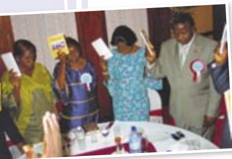
Lancement du Lecteur 2007

En 1981, le Conseil de la région Afrique a décidé de rédiger ses propres notes pour adultes et pour jeunes. Ils avaient la conviction que chaque livre et verset de la Bible devaient être étudiés, y compris les généalogies, qui ont une signification particulière pour