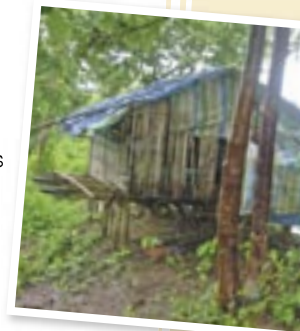
Foyer de garçons