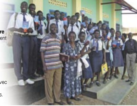
Ministère de la Ligue dans les écoles du Sud-Soudan

De nombreux bénévoles veulent travailler avec la Ligue, mais ils ont besoin de formation. Le mouvement a aussi besoin de matériel de formation et de fonds pour faire tourner le ministère.