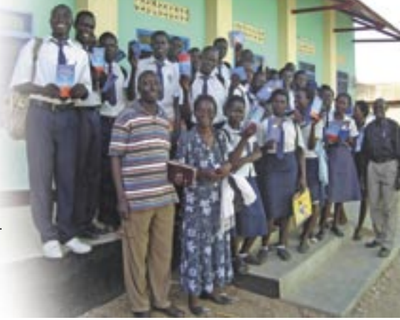
Ministerio de UB en escuelas en el sur de Sudán

Dado que la UB en Sudán trabaja principalmente con colegios de educación secundaria, que actualmente operan en todo el sur de Sudán, con iglesias y con familias, tenemos puertas de oportunidad abiertas de par y en par. Hay muchos voluntarios dispuestos a servir con la UB que necesitan de capacitación. El movimiento también necesita materiales de capacitación y fondos para llevar a cabo el ministerio.