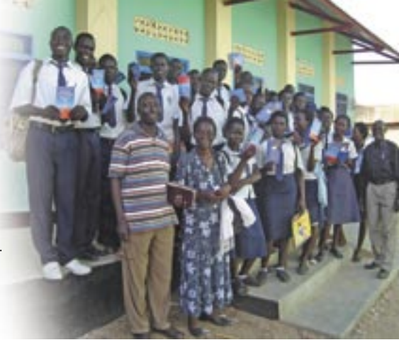
Ministerio de UB en escuelas en el sur de Sudán

Dado que la UB en Sudán trabaja principalmente con colegios de educación secundaria, que actualmente operan en todo el sur de Sudán, con iglesias y con familias, tenemos puertas de oportunidad abiertas de par y en par. Hay muchos voluntarios dispuestos a servir con la UB que necesitan de capacitación. El movimiento también necesita materiales de capacitación y fondos para llevar a cabo el ministerio.