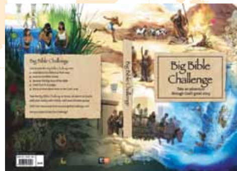
El Gran Desafío de la Biblia