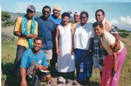
Pacífico - UB Fiji

Por favor ore por los niños y que el Señor provea para este ministerio. Agradecemos su oración y apoyo.