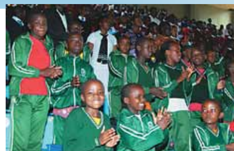
Mitin para la Paz en Kenya

UB de las Islas Salomón es consciente del valor de los medios. Se usan fotos de los campamentos, deportes, visitas a los colegios y otras actividades en los boletines informativos como también para enviarlos a los medios. La televisión local ha transmitido un taller de KidsGames y el periódico Solomon Star ha llevado un reportaje de la iniciativa KidsGames. Usamos las redes sociales como el Facebook para transmitir actualizaciones de programas y actividades. Los medios digitales ayudan a transmitir novedades a nuestros socios locales y la UB alrededor del mundo.