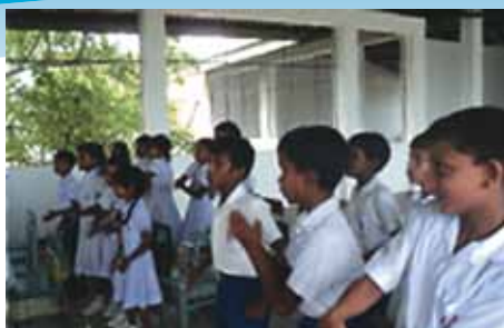
Asia Meridional - Sri Lanka