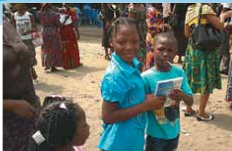
Presentación de guías de lectura bíblica