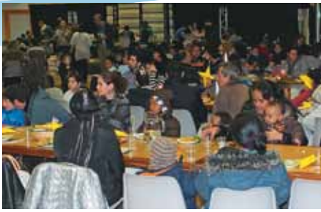
UB Suiza, refugiados comiendo