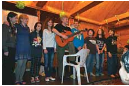
Campamento de invierno en Moscú

Fuimos a servir a Dios en el extranjero pero ahora Dios nos ha traído a los extranjeros. ¡Es una maravillosa oportunidad!