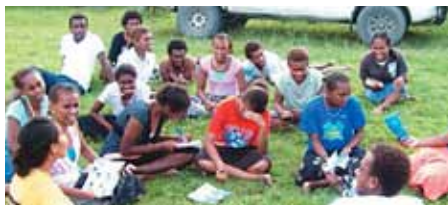
UB las Islas Salomón

Pida por favor sabiduría para todos los que participan y los recursos necesarios para poder completar el proyecto.