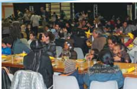
LLB Suisse, réfugiés. Un repas