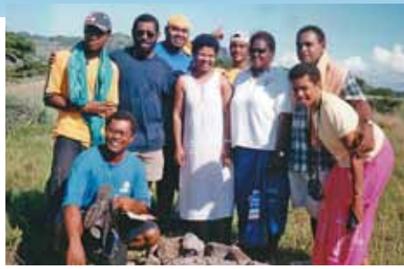
Pacifique – LLB Fidji

Merci de prier pour les enfants, et que le Seigneur pourvoie pour ce ministère. Merci pour vos prières et votre partenariat.