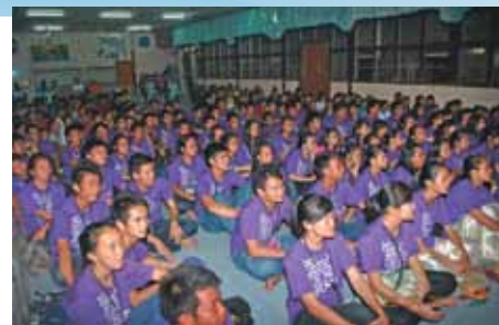
Camp commun ISCF Asie de l'Est et de l'Ouest à SMK Tutoh Apah

Avant de repartir, l'équipe de la Ligue distribue des boissons fraîches et des pâtisseries. Elle sera de retour le samedi suivant. Pour les victimes de la guérilla à Barranquilla qui ont tellement souffert, traumatisme, espoir et amour sont les maîtres mots pour leurs cœurs brisés.