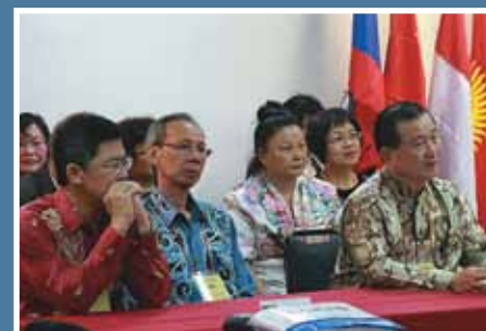
Réunion du Conseil de l'Asie de l'Est et de l'Ouest