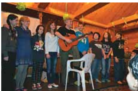
Camp d’hiver de Moscou

Nous sommes partis servir Dieu auprès des populations à l’étranger et aujourd’hui il les amène à nous. Quelle opportunité formidable !