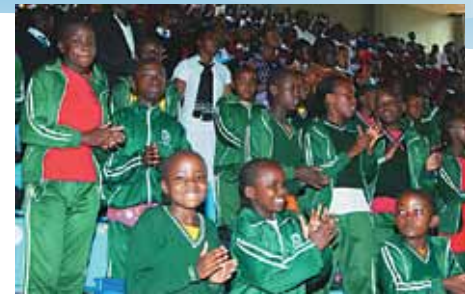
Rallye de la paix au Kenya

La Ligue Îles Salomon est consciente de l'importance des médias. Des photos des camps, des événements sportifs, des programmes d'évangélisation, des visites dans les écoles et des autres activités sont utilisées dans les bulletins et envoyées aux médias. La télévision locale a couvert un atelier de KidsGames et le quotidien Solomon Star a relaté l'initiative KidsGames. Les réseaux sociaux comme Facebook sont également utilisés pour diffuser des informations relatives au programme et aux activités. Les médias numériques permettent de diffuser les nouvelles aux partenaires locaux et à la Ligue dans le monde entier.