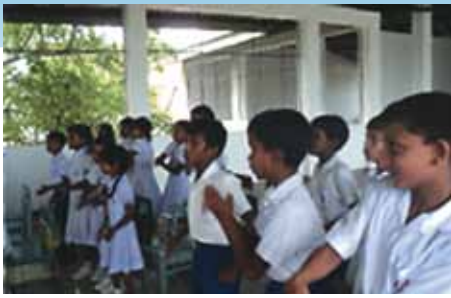
Asie du Sud – Sri Lanka