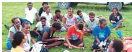
LLB Îles Salomon

Merci de prier que nous fassions preuve de sagesse pour tout ce que cela implique et que nous recevions les ressources nécessaires pour mener ce projet à bien.