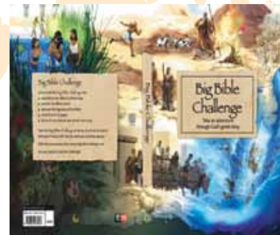
La Bible, le grand défi

Pour plus de détails de la part de Clayton Fergie : claytonf@su-international.org