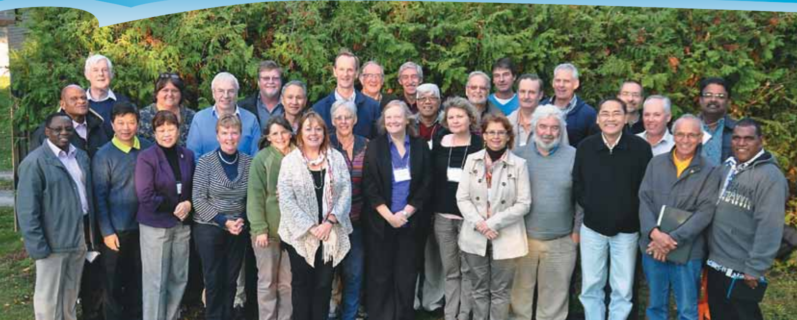
Conseil international de la Ligue, Jackson's Point, 2014